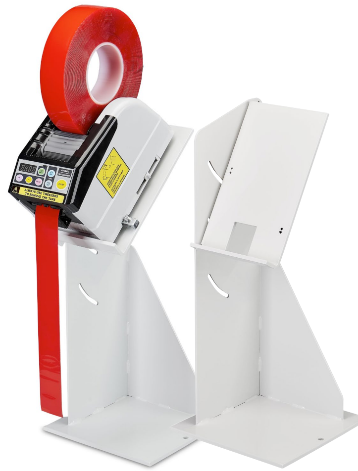
Gerätehalter mit verstellbarer Neigung 900-5708235-A

Großer schwarzer Rollenkerne ø 76mm oder 38mm Gewicht: 1,5kg