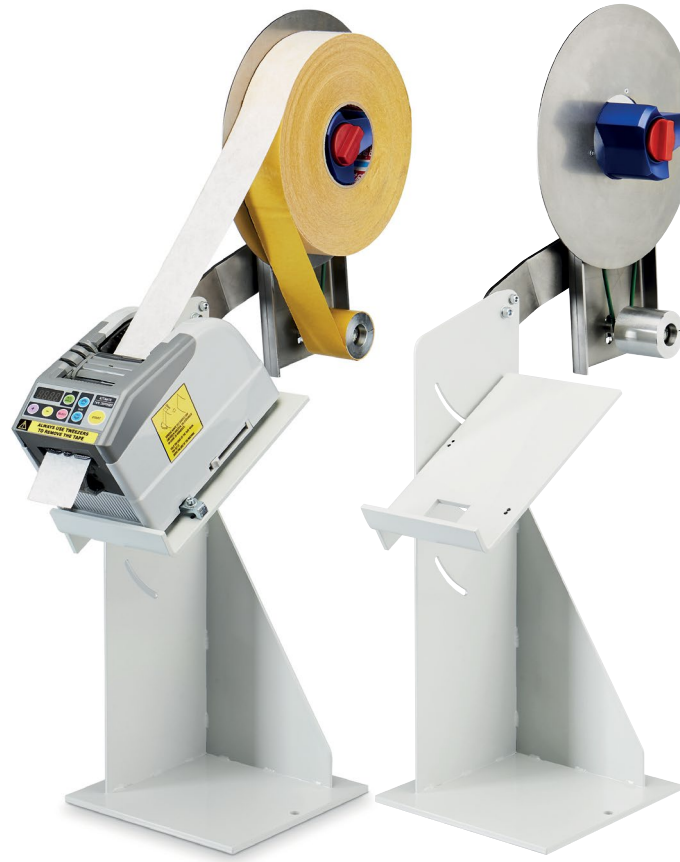
Gerätehalter mit verstellbarer Neigung 900-5708235-A mit Aufspulvorrichtung 5705318 für Trägerpapier bis 60mm Bandbreite mit gebremstem Rollenkerne

Großer blauer Rollenkerne ø 76mm Gewicht: 5,4kg (ohne Maschine)