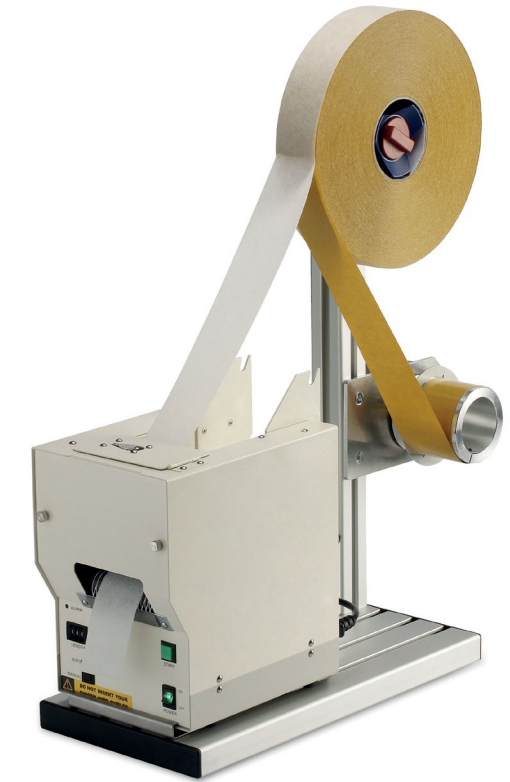
Aufspulvorrichtung 1700459-444 pneumatische Aufwicklung

Ausführung mit kleiner Rollendurchmesser ø 35mm oder großen Rollendurchmesser ø 76mm Gewicht: 5,3kg