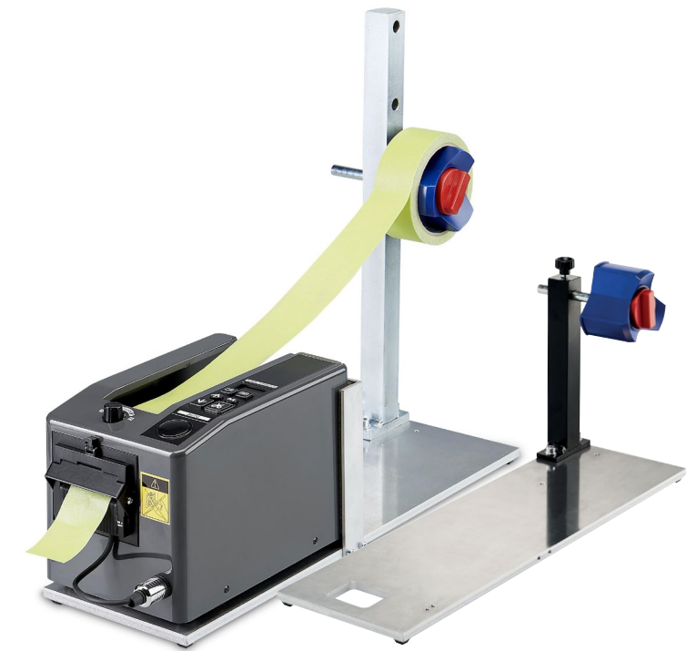
Rollenhalter 5401580 / 5401580.900 für Roller bis max. 300mm Außendurchmesser mit Grundplatte

passend zu: A690, A691, A693, A695, A696, A697, A698, A900.6, A900.6F, A900.12