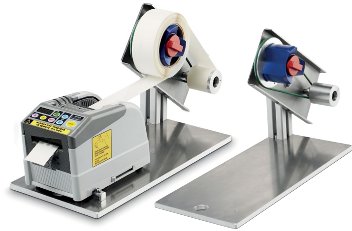
Rollenhalter 5403063 für Rollen bis max. 500mm Außendurchmesser mit Grundplatte

Großer blauer Rollenkerne ø 76mm Gewicht: 1,9kg (ohne Maschine)