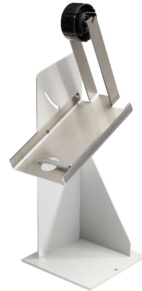
Gerätehalter mit verstellbarer Neigung mit Rollenhalter für Rollen bis max 220mm Außendurchmesser 900-5708235-A + 900-5401335