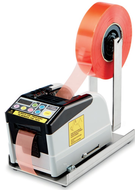
Rollenhalter 5401335 5401335/900 5401335/619

Großer blauer Rollenkerne ø 76mm Gewicht: 3,4kg (ohne Maschine)