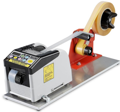
Aufspulvorrichtung 5401342 für Rollen bis max. 240mm Außendurchmesser mit Grundplatte

passend zu: A690, A691, A693, A695, A696, A697, A698, A900.6, A900.6F, A900.12