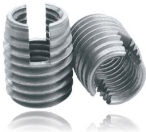
Rostfreier Stahl 1.4105 Rostfreier Stahl 1.4305